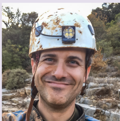
Votre secrétaire CV